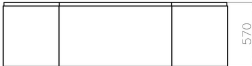
Ansicht von vorn